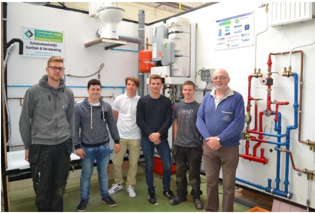
1 VTI Ieper