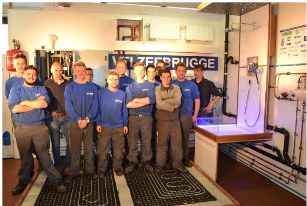
5 VTI Zeebrugge