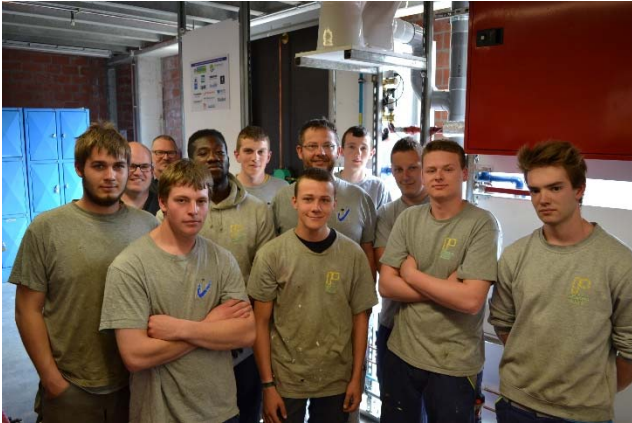
3 VTI Oostende