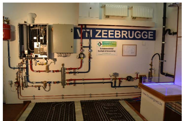
7 Installatie VTI-Zeebrugge