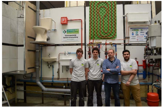
2 VTI Kortrijk