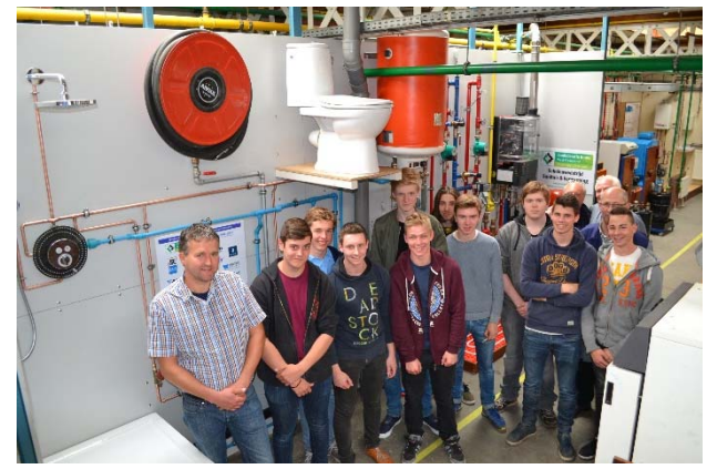
4 VTI Waregem