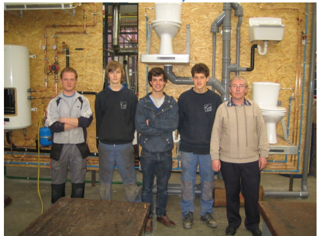
4 VTI Roeselare