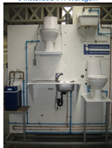
8 Installatie VTI-Waregem