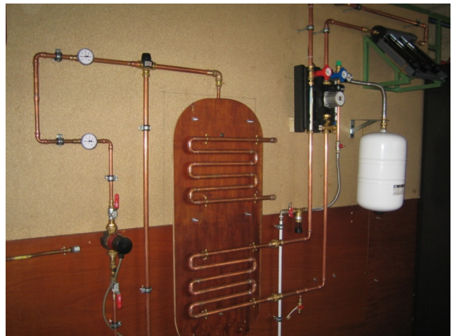
6 Installatie VTI-Waregem