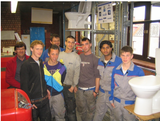
3 VTI Oostende