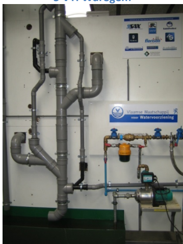
7 Installatie VTI-Waregem