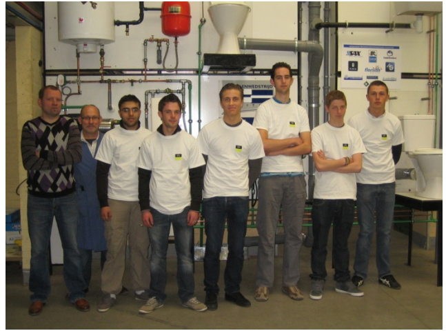
2 VTI Kortrijk