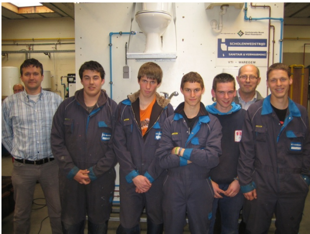
5 VTI Waregem