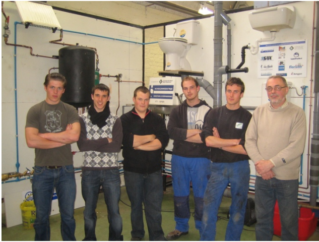
1 VTI Ieper